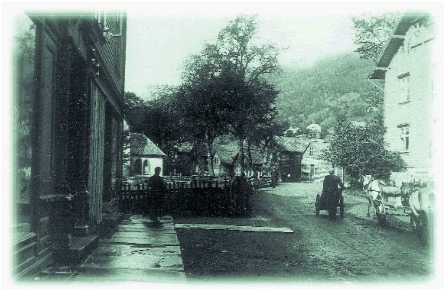
Vangen omlag 1925. Lahlumhuset til venstre og Simons-Margreta huset til høgre. I bakgrunnen stallane (der Kyrkjebø står i dag).

Under andre verdskrigen var det mykje pengar i omlaup og lite å få kjøpt. Folk sette pengar i banken og nytta inntektene til å betala ned på eldre lån. For bankane førde