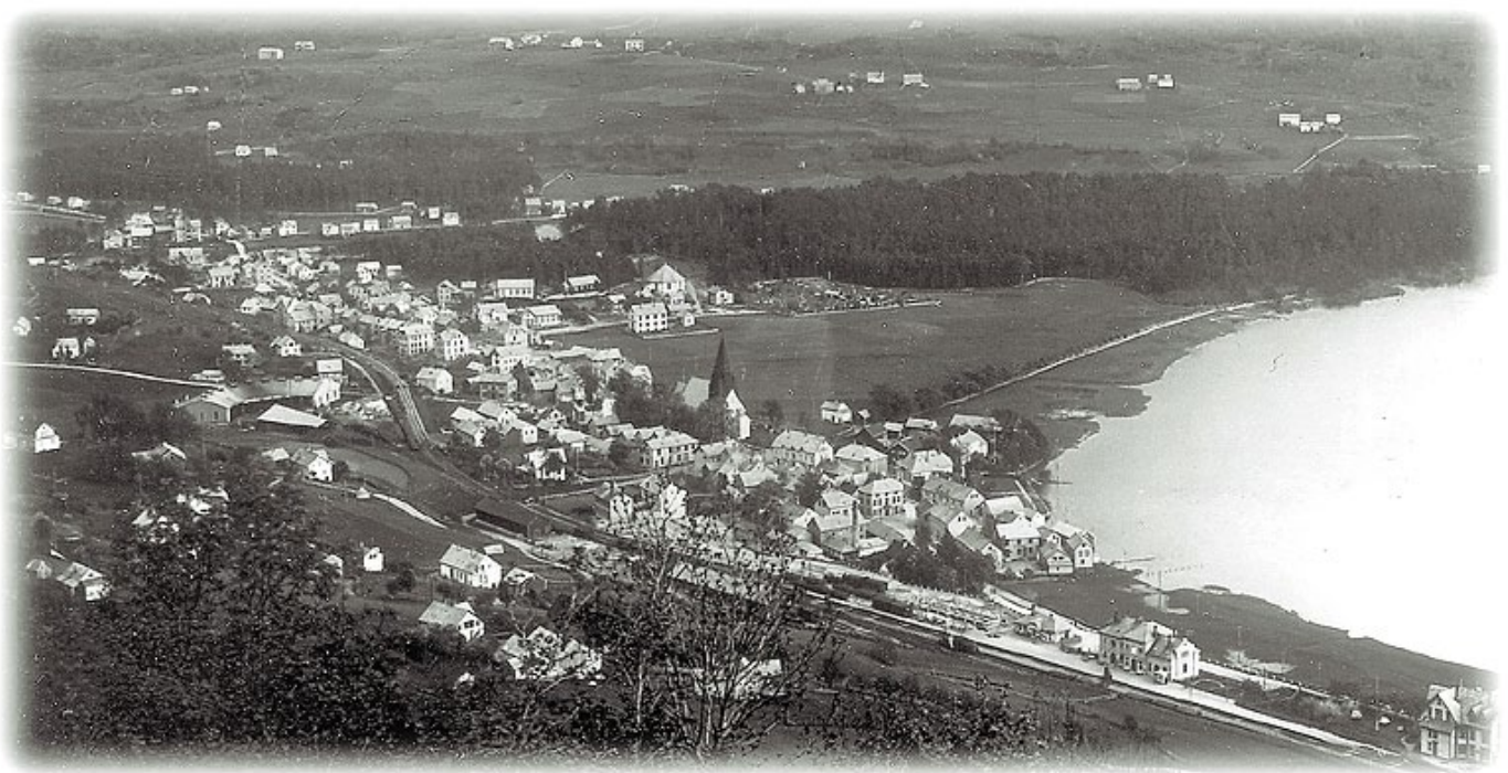
Voss omlag 1910.