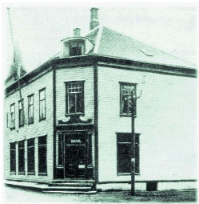
Bankbygningen i Nedregate, som brann i 1940.

dette til vanskar med å plassera pengane, og dei sat med store kassareservar. Utviklinga frå 1941 til 1945 viser at innskot i banken hadde auka frå kr 5.651.000 til kr. 9.598.000, utlån hadde minka frå kr 1.456.000 til kr 1.146.000, og rådveldekapitalen auka frå kr 8.521.000 til kr 12.900.000.