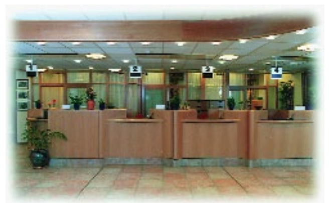
Banken i 1998, sett frå utsida og frå ekspedisjonslokalet.

Turisme, handel og tenesteyting av ymse slag har auka mykje, samtidig som bygg- og anlegg og verkstadindustri har teke opp ny teknologi og har hevda seg i tevling både nasjonalt og internasjonalt, og har fått oppdrag til utføring i nære og fjerne utland. – Bustadbyggjing har gått i bylgjer med toppar og bylgjedalar frå tid til tid, men mengda av bustader har gått mykje opp frå tiår til tiår. Både innan næringslivet og bustadbyggjinga har Vekselbanken heile tida hatt tenester å yta som har vore til framhjelp for samfunnet under eitt, og for den einskilde.