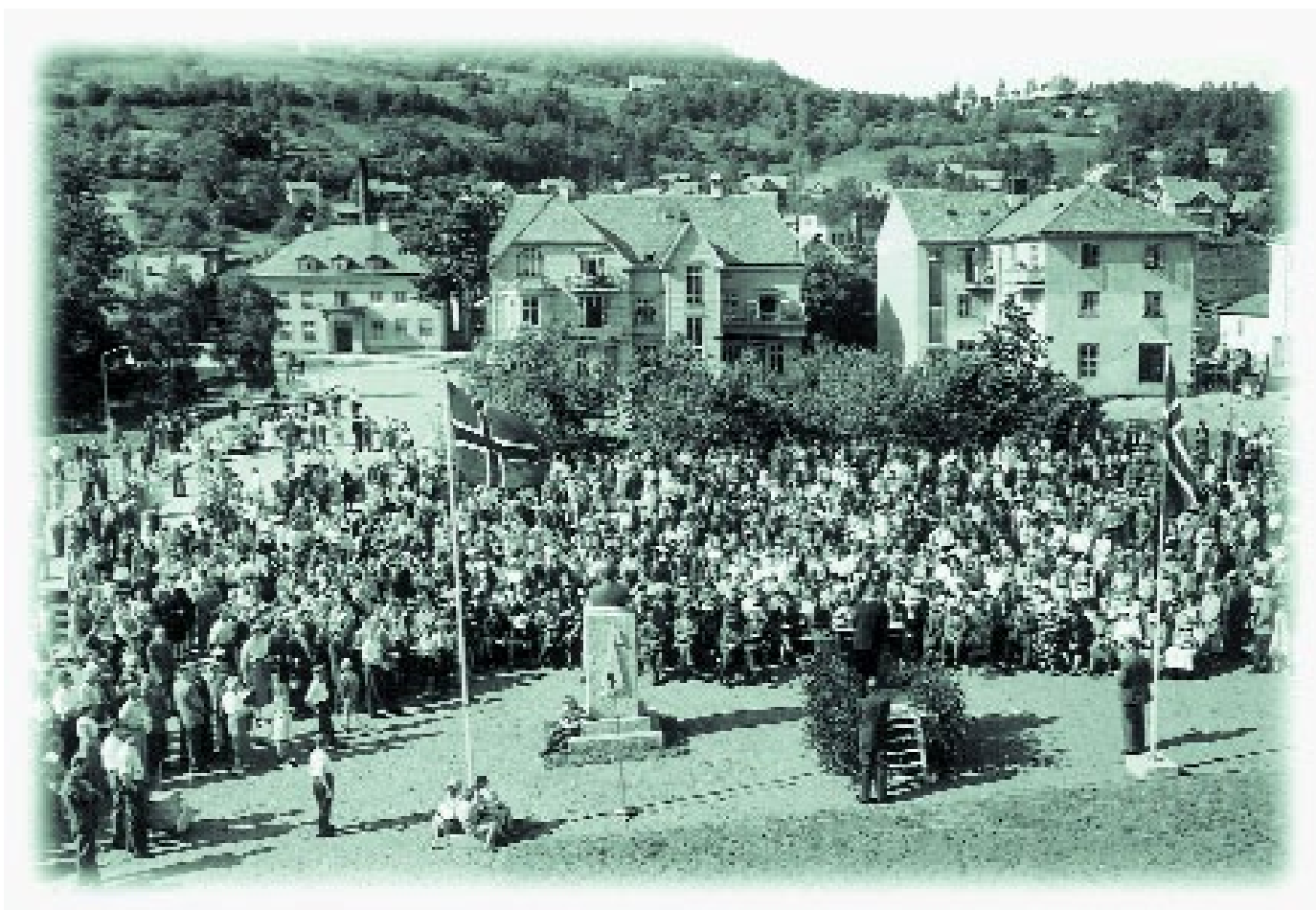
Avdukinga av minnesmerket over Per Sivle framfor tinghuset i 1957. Vekselsbanken i bakgrunnen.

Åra frå 1945 til 1950 var merkte av rasjonering og knappe mengder av byggjevyrke og varer som trongst til atterreisinga, men stoda vart smått om senn betre, og frå 1950 var det mykje auke i husbygging. Dei fyrste åra etter krigen gjekk òg tekstilindustrien i bygda svært godt, med opp til tre skift i døgeret på Voss Uldvarefabrik. Frå slutten av 1950-åra vart tevlinga hardare med nyoppbygd tekstilindustri i Tyskland og England. Etter 1960-åra er det slutt på tekstilindustrien på Voss.